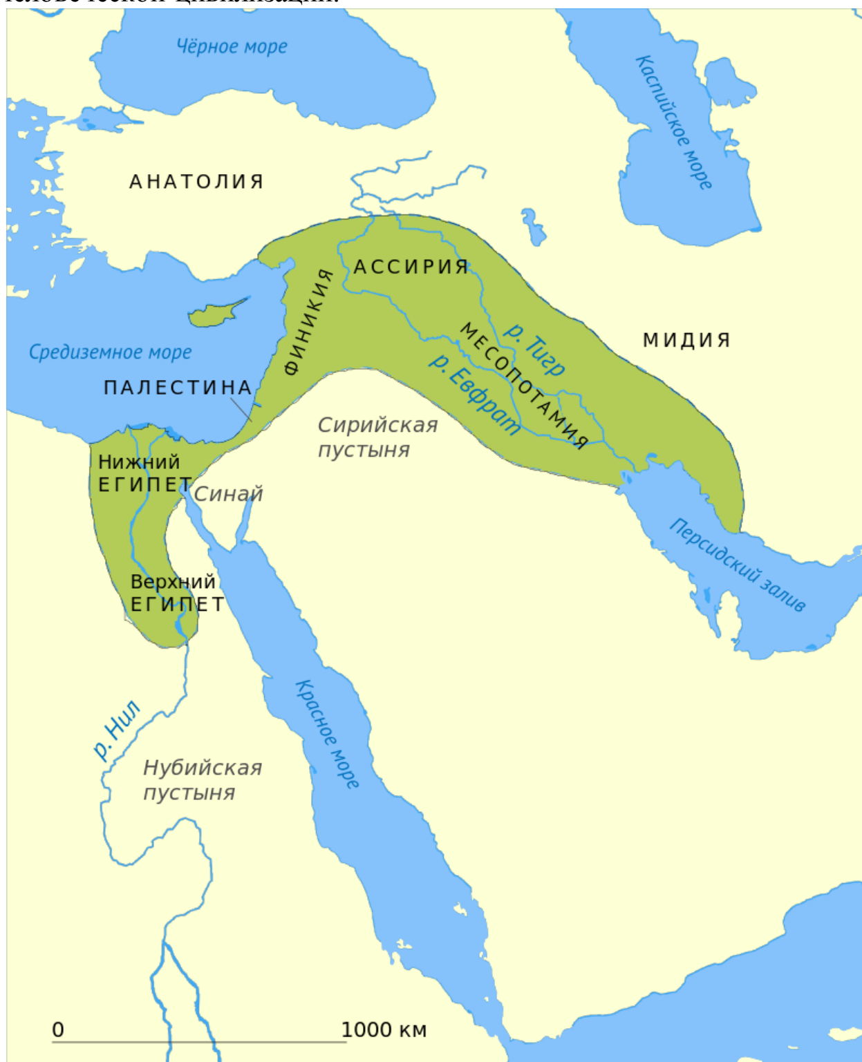
Рис. 2. Плодородный полумесяц – плодородные земли, названные так американским археологом Джеймсом Генри Брэстедом в его книге «Древние летописи Египта» в 1906 году.

Плодородный полумесяц связывает районы древнего Египта и Месопотамии, и поэтому его справедливо считают колыбелью человеческой цивилизации.